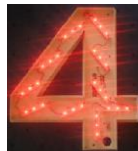
Beispiel: Profilbuchstabe 400mm hoch, 150mm tief, rotes Bestückt mit 10 Modulen.

Leuchte und Steuergerät erfüllen EN 60598-2-23